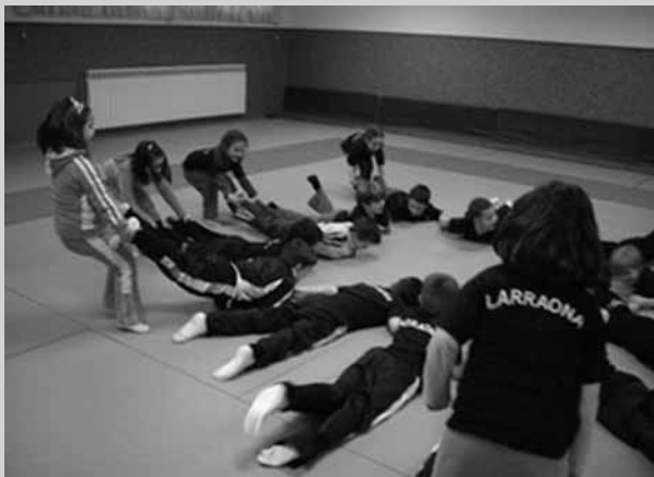
Kirol hastapenetarako eskola.

Taldeak zuzentzen 24 entrenatzaile daude eta beste hainbeste talde-ordezkarri daude ezin eskertuzko laguntza eskaintzen. Aurten gurasoen presentzia seme-alaben hezkuntza- eta kirol-eremuan eta elkartearen egituran sendotu nahi izan da.