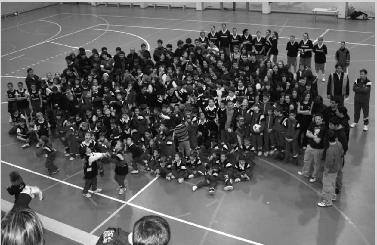
Ursulinas Kirol Taldea.

Helburu horiek atxiki ahal izateko, 45 begirale-entrenatzaileen laguntza izango dugu. Horiek guztiak ardura-