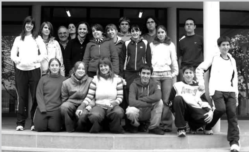
Gazteen ilusiotik ernamuntzen den sormena inoiz ez dugu helduok eskainiko. Idazleen taldea, 2006-2007 ikasturtea.

Artikuluak bildu ostean, argitalpena gorpuzteko unea iristen da. Diru gehiegirik gastatu gabe, arte grafikoetako edozein enpresak zeregin hori egingo du. Hala eta guztiz ere, merkeagoa da eta, batez ere, askoz hezigarriagoa, aldizkaria ikastetxean bertan egituratzea. Orrialde baten maketa egitea, azala antolatzea, irudiak hautatzea edo izenburuak eztabaidatzea, hezigarriak bezain motibatzaileak dira.