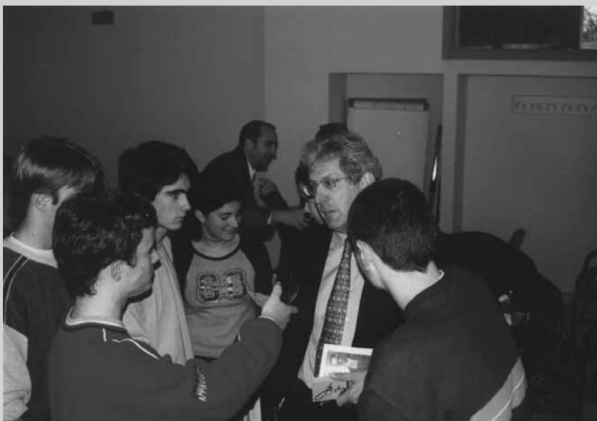
Pedro Miguel Etxenikeri elkarrizketa (Honoris Causa doktorea 2008an, Nafarroako Unibertsitate Publikoan)

Gure aldizkaria kanpoalderako lehiario irikia izatea nahi genuen, nahi zuten orok gure ikastetxeko bizimoduaren berri eskuratu ahal izan zezan, nahiz eta beste edozein ikastetxetan egiten dena antzekoa den. Bestaldetik ere bigarren helburu bat otu zitzaigun: telebistan hasiak ziren hainbat teleserietan biziki irudi artifiziala ematen zen ikastetxeetako jarduteaz, eta nolabait irudi hura zuzendu nahi genuen. Ildo horretatik aldizkariaren inguruko ikastetxeko zuzendariordetzaren egituratu txertatu zen, horrela “ezohizkoak” ziren ekintzen berri zehatza eman ahal izateko: kirolak, eskolaz kanpokoak, lehiaketak, sariak, nabarmenduriko ikasleak edozein esparrutan bai Nafarroa mailan zein kanpokoan (nazioarteko bat baino gehiago izatera iritsi ginen) eta abar.