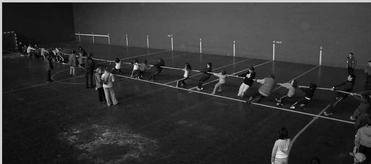
Jarduera osagarria Ixabako pilotalekuan.