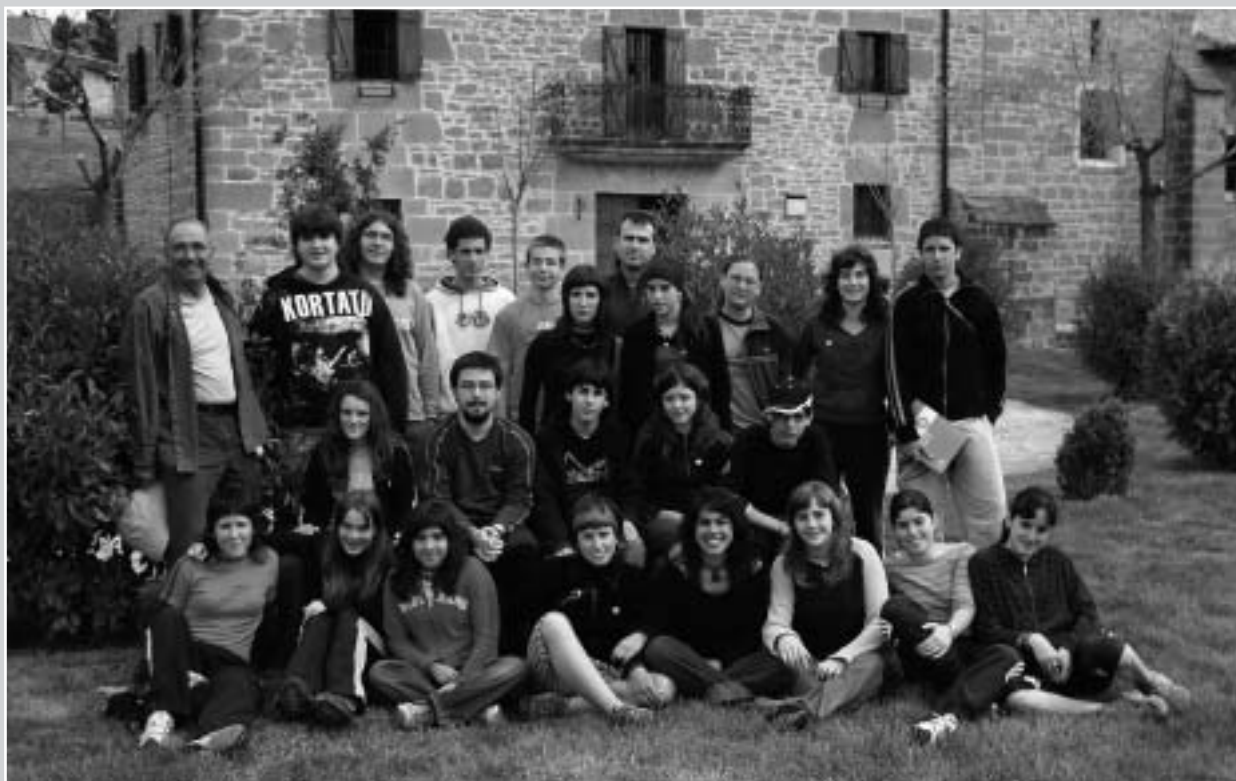
Biurdana BHIko Tartekaritza taldea

Ikastetxean modu desberdinetan eman dugu gure berri, klasez klase guk geuk azalduz eta talde osoa agertzen den eskuorriak ere badira, hala ere zaila da mingarriak diren gatazkak konpontzeko oraindik ere nahiko ezezaguna suertatzen den bitartekotzan konfidantza jartzea,