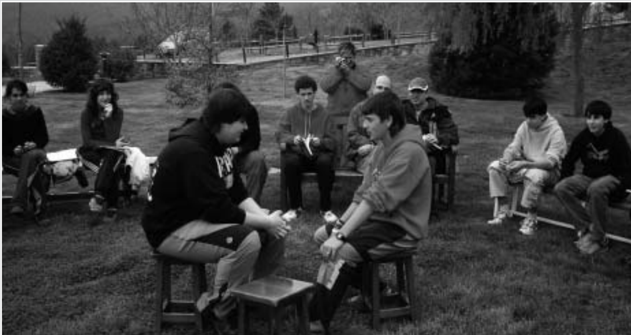
Biurduna BHIko Tartekaritza taldearen lan saioa