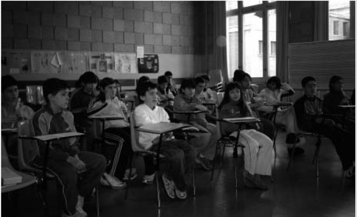
Gurutze Plazako BHIko ikasleak

hezkuntza-erkidegoa eratzen duten kolektibo ezberdinek parte hartzea, elkarbizitza eta gizarte-kohesioa lortzeko.