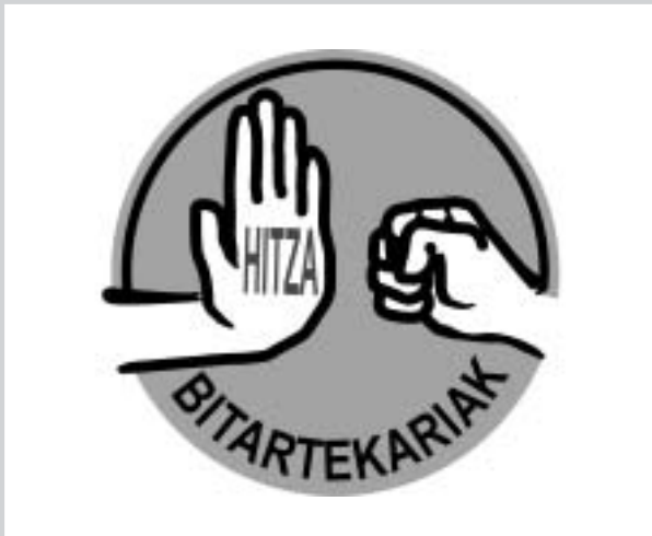
Biurdana BHLko Tartekaritzaren taldearen logotipoa

eta hori nabaritzen da. Horregatik, gure tresna ahalmen handiena bitartekotza informalean datza. Hau da, ikastetxean ez dugu bitartekotza formal askorik burutu baina dugun ahalmena oso baliagarria da edozein momentutan, lagunartean, etxean gurasoekin, irakasleekin... Nik neuk institutuan bitartekotza gutxi egin ditut, baina jendea ulertzeko, jarrerak aztertzeke, pertsona desberdinekin tratatzeko, egoera ezberdinetan nola jokatu jakiteko... ikuspegi zabala eta malgutasuna eman didate bitartekotzaren kontu honekin batera etorri zaizkidan esperientziek eta eskuratu dudak ahalmenak.