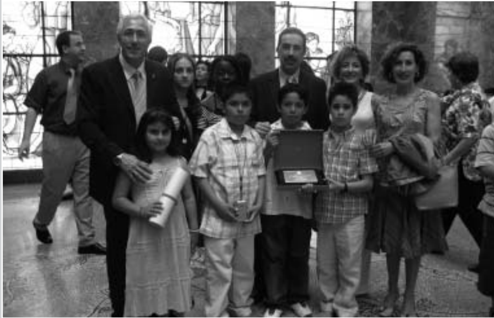
Sari Nazionala ematea Madrilan

berdinetatik jorratu behar dira: pedagogikoa, familiakoa, gizartekoa... guztion ikasleak gizartean bizi daitezen. Lan integratzaile eta elkarbizitza egokia izateko lan hori Hezkuntza Egitasmoaren barruan jaso da, hezkuntzaren inguruan dugun eginkizunaren gida.