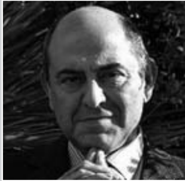
José Antonio Marina.

allá del mundo educativo. Una vez más, la situación en la escuela es un reflejo de la situación extraescolar. La crisis de autoridad es, en parte, fruto del abuso de la autoridad que se dio en el mundo político, social y religioso durante el pasado siglo, lo que produjo un miedo y rechazo de la autoridad, y un descrédito generalizado de todo lo que tuviera que ver con las instituciones y el poder. Por esta razón, sería conveniente un debate social a todos los niveles para recuperar, en primer lugar, la noción y la palabra, que están parcialmente pervertidas. Pondré un ejemplo claro de este escollo lingüístico aplicado a la educación. Los tratadistas anglosajones distinguen cuatro estilos fundamentales de "parenting", de educación y crianza: negligente, permisivo, autoritario y autoritativo ( authoritative ). Con esta palabra indican un modo de educar exigente, pero cálido, atento a las necesidades e incluso a los derechos del niño, que no cae en excesos autoritarios del tipo "cuando seas padre comerás huevos", que todos escuchamos en nuestra infancia. Pues bien, el término " authoritative " no tiene sinónimo en castellano. Se le ha solido traducir como "democrático", lo que no me parece admisible. La expresión más correcta sería "con autoridad", pero resulta larga y confusa. En mis libros la he traducido por "educación responsable", siendo consciente de la falta de exactitud.