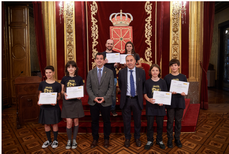
Alumnado del Colegio Luis Amigó.