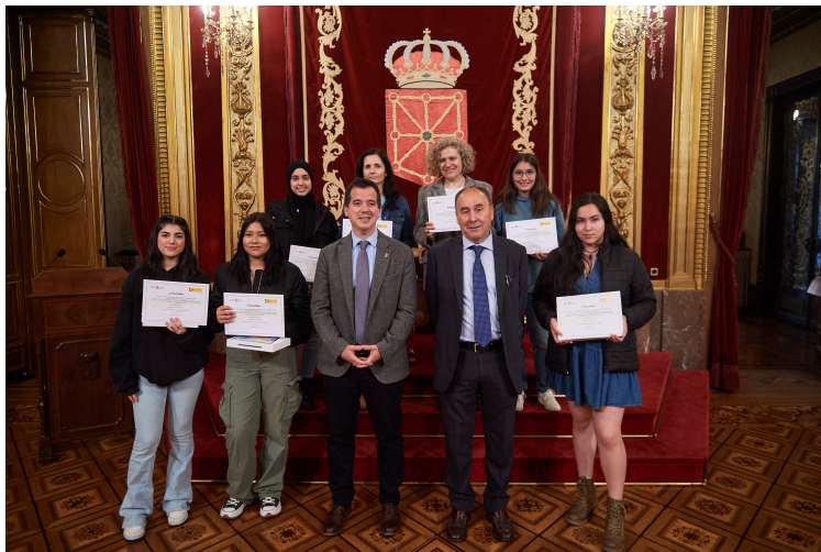
Alumnado del Instituto Padre Moret-Irubide.