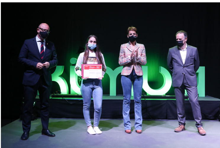
Una de las premiadas, tras recoger el título.