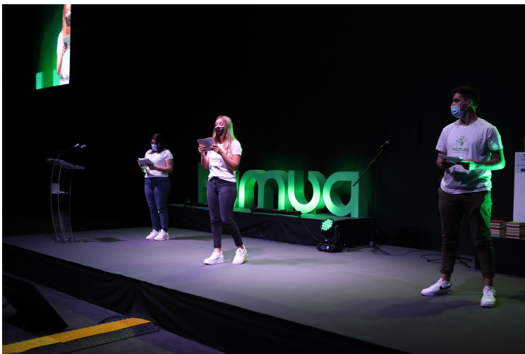
Un momento de la jornada.