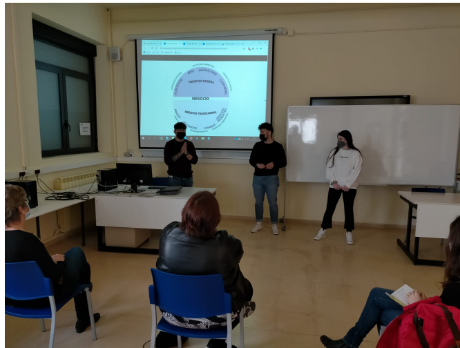
📷 Estudiantes de FP de Tudela han realizado propuestas para revitalizar el comercio local.