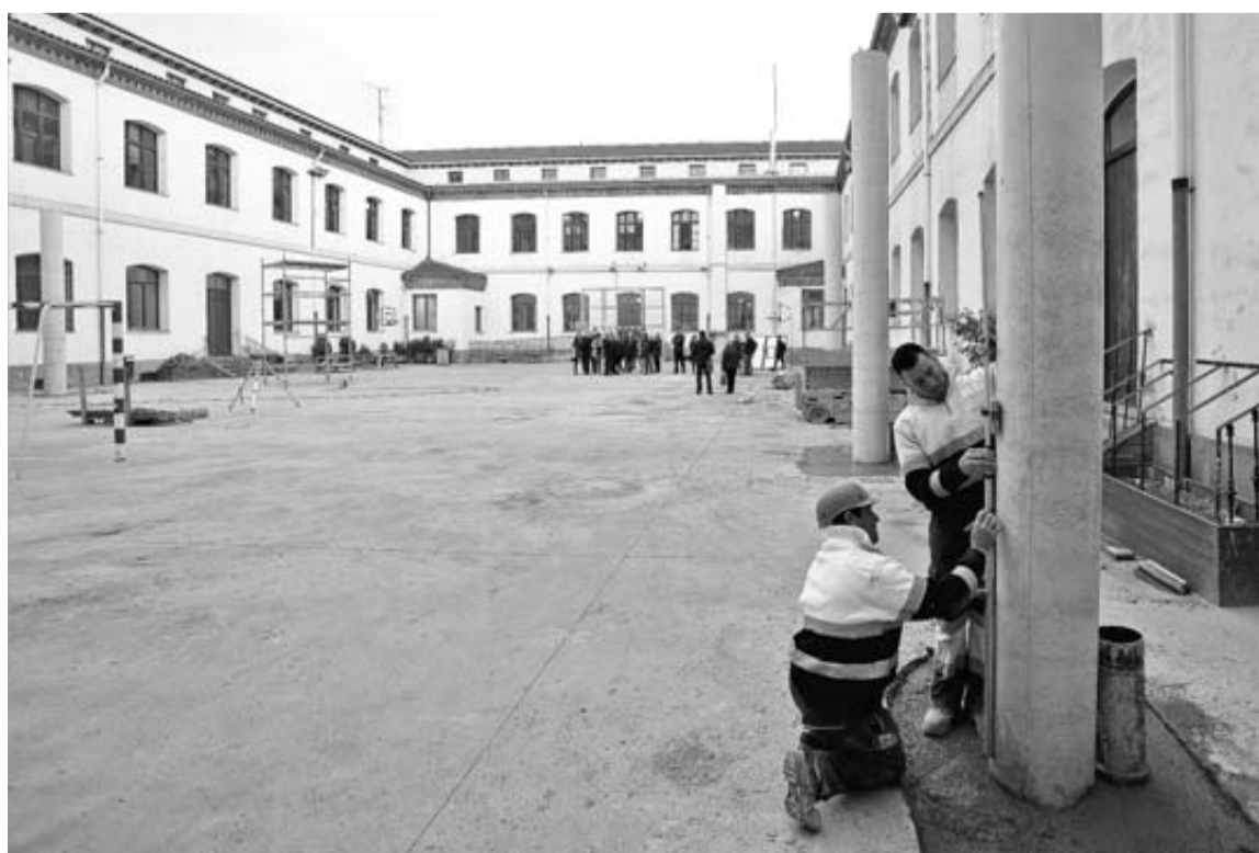
Operarios trabajan en los pilares de la nueva cubierta para el patio del colegio San Francisco de Pamplona.

entonces hubo 9.738 comensales, un 26,7% más. Sin embargo, el gasto se ha mantenido bastante estable: 2,61 millones de euros el año pasado y 2,82 el curso anterior. El propio informe del Consejo Escolar de Navarra lo explica así: "Las oscilaciones que presenta el gasto ejecutado en el servicio de comedor pueden ser debidas, en su caso, por la gestión de este servicio, ya que las ausencias del alumnado no se abonan al no prestarse el servicio; además, la implantación de la jornada continua en los centros docentes podría afectar también a la disminución del gasto del servicio".