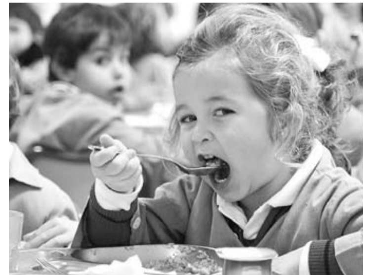
Una alumna del segundo ciclo de Infantil, en un comedor escolar. DN

más de 36 millones de euros que se destinaron al presupuesto global para obras educativas en 2010, se pasó a los apenas 5 millones en 2012, suelo de la inversión en nuevos centros y equipamientos. Esa cifra se mantuvo estable hasta 2016 (6 millones de euros) siendo 2017 el año del despegue en esta partida (12,37 millones de euros).