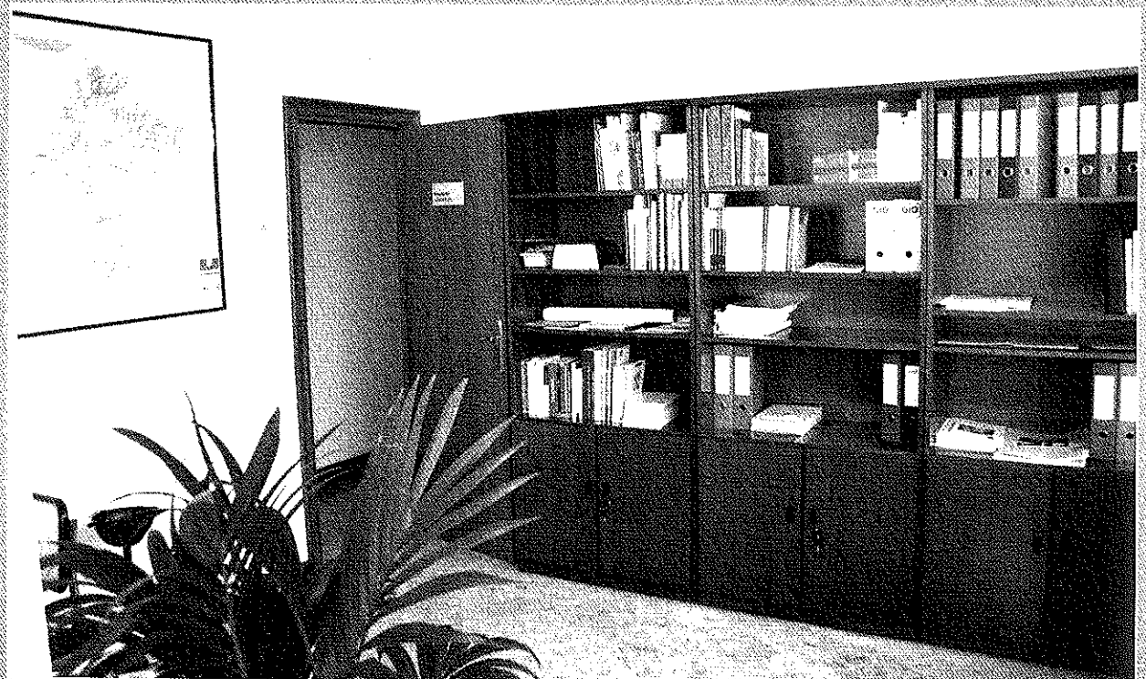
Instalaciones del Consejo Escolar de Navarra