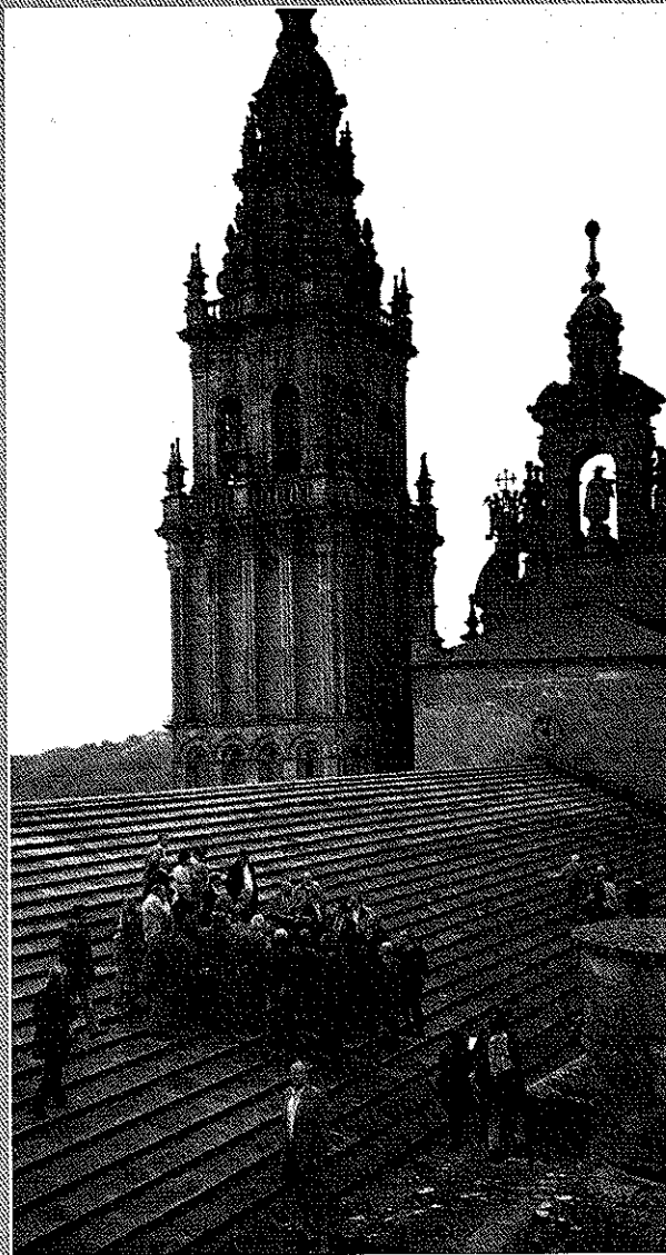
En los XII Encuentros de Santiago de Compostela, mayo 2001.

acción en este tema de la convivencia, se produce de forma espontánea una mejora, aún sin comenzar la actuación concreta.