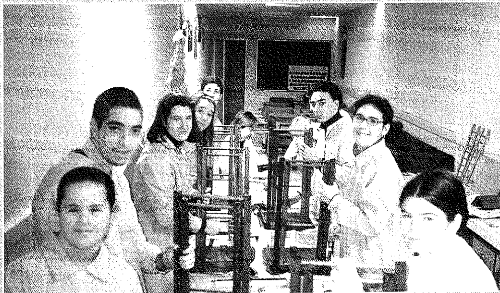
"Los chicos/as del PIPE son unos artistas trabajando, y se lo pasan genial pintando."

Finalmente, nos está llegando una nueva diversidad com