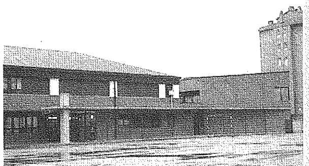
Aula del Askatasuna

das a satisfacer los intereses de los alumnos y a crearles otros nuevos.