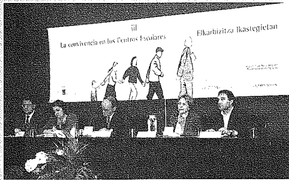
III Jornada del Consejo Escolar

Tener una perspectiva más abierta de los estudiantes.