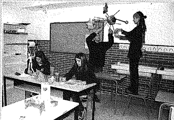
Aula del I.E.S. Zizur B.H.I.

nuestra Comunidad Autónoma, con un "Taller de Publicidad" en el que se reflexionó sobre la publicidad y su capacidad de manipulación, de discriminación y la incitación al consumo. Así mismo alumnos de 3º y 4º de la ESO y 1º de Bachillerato idearon y grabaron una