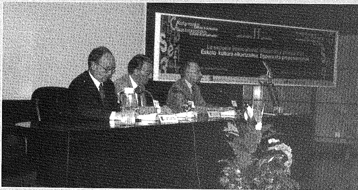
Pie: II Jornada de Consejos Escolares de Centro con el Consejo Escolar de Navarra, abril 2000

Como el contenido y las sugerencias realizadas en las exposiciones tienen un indudable interés, el Consejo Escolar de Navarra va a publicar el contenido íntegro de las mismas que se distribuirá entre todos los participantes.