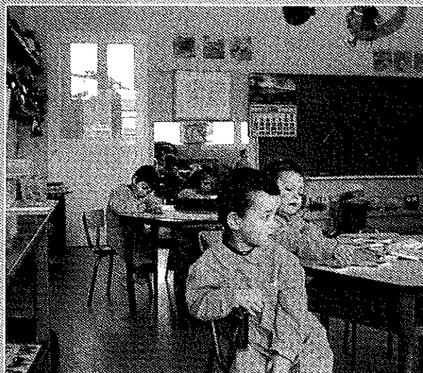
Colegio Mater-Dei. Ula de Infantil 1ª.

Hoy, no solamente mantiene las etapas de educa-