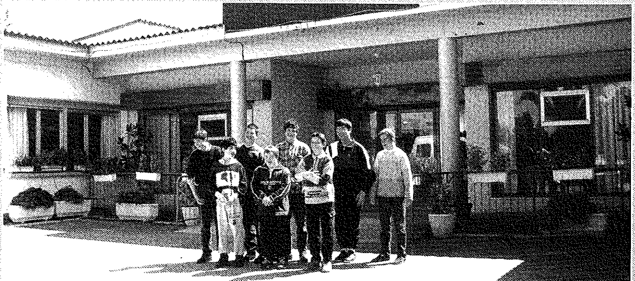
Colegio Público de Educación Especial "Torre Monreal"

Tudela, treinta de Marzo de 2000. EL EQUIPO DIRECTIVO DEL CENTRO