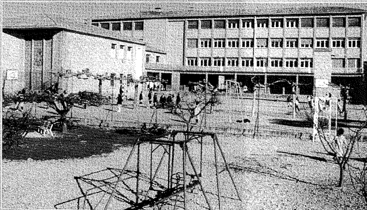
Vista general del Colegio Mater-Dei. Patios y parque infantil.