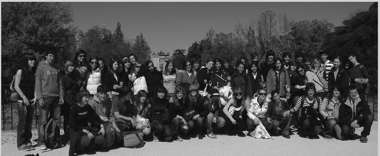
Alumnos y alumnas del IES Toki Ona BHI en Milán