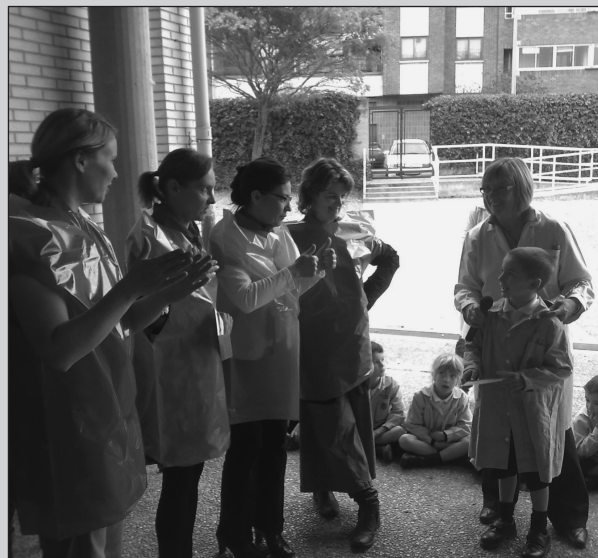
Actividad con los alumnos

Se le considera uno de los padres de la educación moderna.