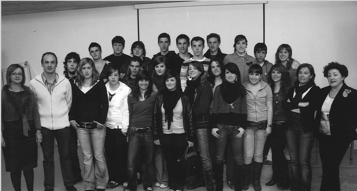
Los estudiantes de Zizur y de Cantau que han participado en el intercambio este año, junto con sus profesores

El Departamento de francés está muy satisfecho con este programa de inmersión lingüística ya que ha supuesto una primera toma de contacto con hablantes francófonos para la mayoría de los alumnos, y la mejoría que han experimentado tanto en la comprensión oral como en la expresión ha sido muy notable.