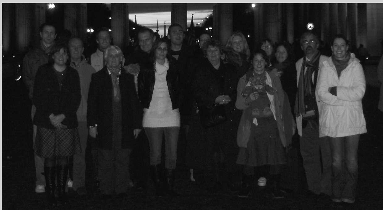
Representantes de las cinco escuelas

Volvimos a casa con el objetivo bien cumplido, nos conocimos y establecimos los niveles de determinación del