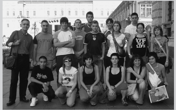
Participantes en el Programa Leonardo en la “Piazza del Castello” de Turín

El número de alumnos que van participando en el programa Leonardo por parte de nuestra Escuela viene oscilando entre las 12 y las 18 personas a lo largo de los úl-