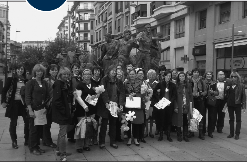
Profesorado visitante en un paseo por Pamplona

En Pamplona se ha recurrido a lo que más nos distingue fuera de nuestras fronteras: las fiestas de San Fermin, y concretamente los encierros. A ello añadiremos referencias a los deportes rurales.