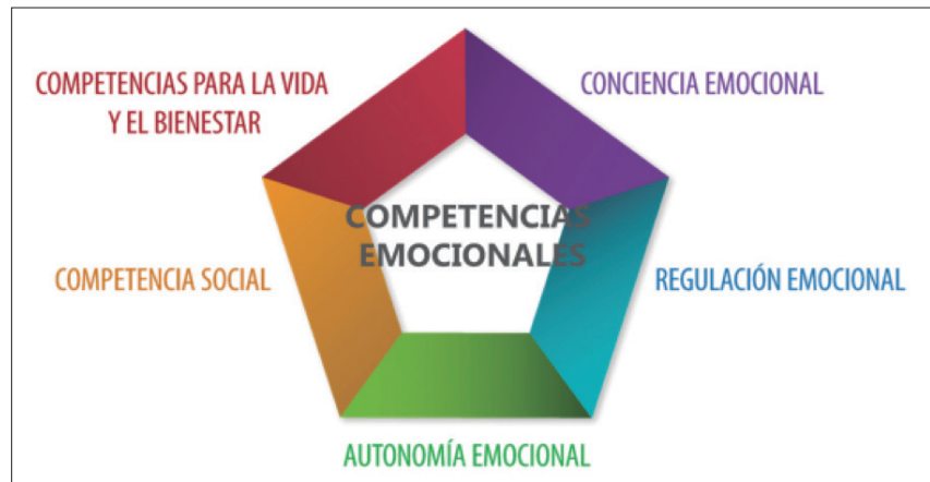
Cuadro 1. Modelo de competencias emocionales desarrollado por GROU (Grup de Recerca en Orientació Psicopedagògica)

La regulación de las emociones significa cambiar el comportamiento impulsivo por una respuesta apropiada a las emociones que experimentamos. No hay que confundir la regulación emocional con la represión. La regulación consiste en un