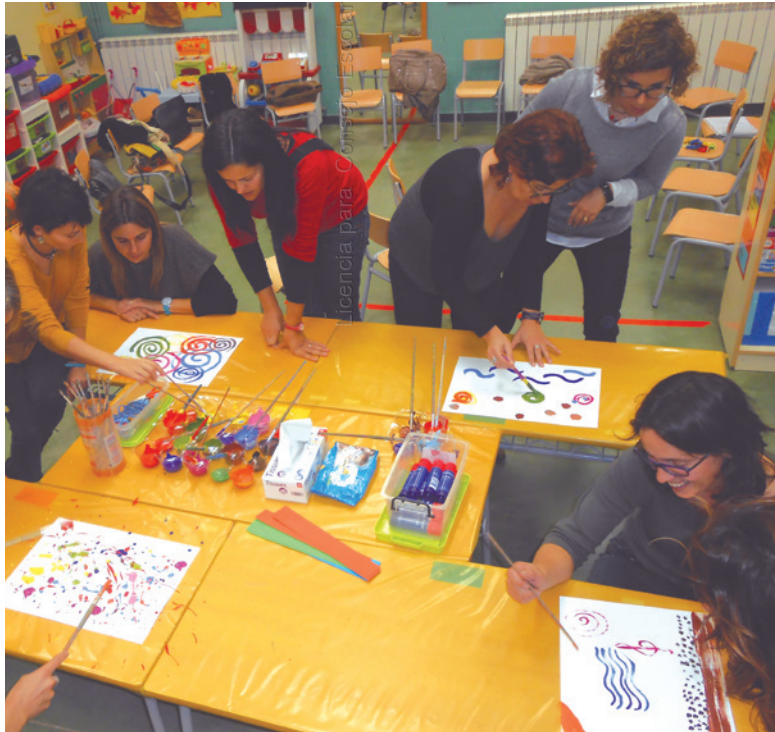
Escuela El Despejido

▣ PALABRAS CLAVE: familias, transformar, compartir, retos, aprendizaje, participación, implicación, reuniones, comunidad de aprendizaje.