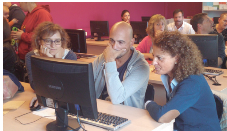
Imagen 5. Reunión de padres y madres de los Mayores