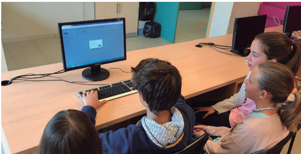
Imagen 4. Los Mayores preparamos la reunión de padres