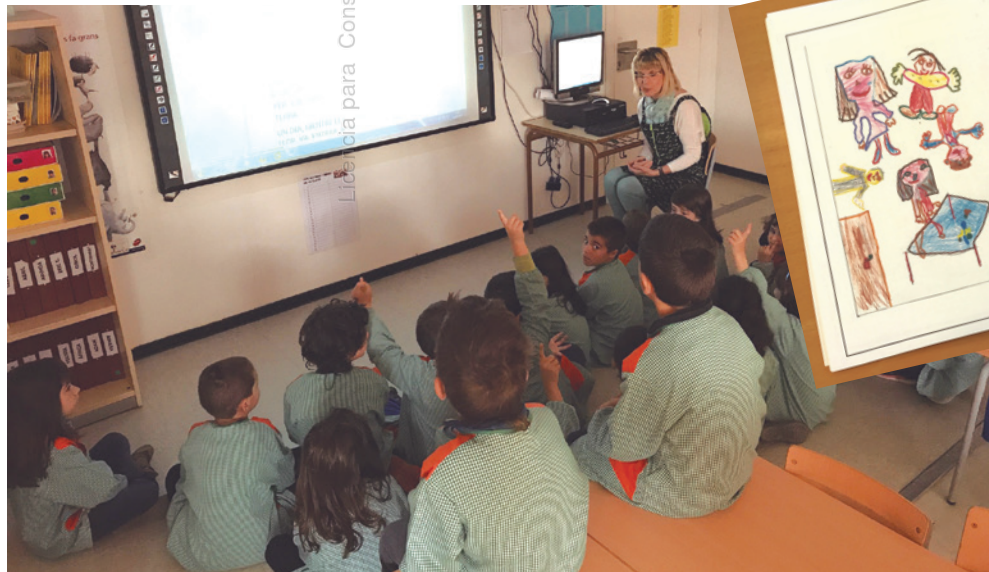
Imagen 2. Los Medianos preparamos la reunión de padres y madres

Al día siguiente, los niños y niñas llegan muy ilusionados a la escuela con el deseo de conocer los cuentos que les han escrito sus padres y madres. Comienza entonces un trabajo de ilustración para acompañar el texto. Este trabajo se materializa en diferentes murales que ocuparán el pasillo cercano a las aulas; de este modo, se hace visible a toda la comunidad educativa y puede ser utilizado como recurso didáctico.