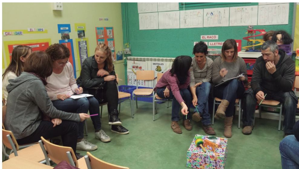
Imagen 1. Reunión de padres del grupo de los Pequeños