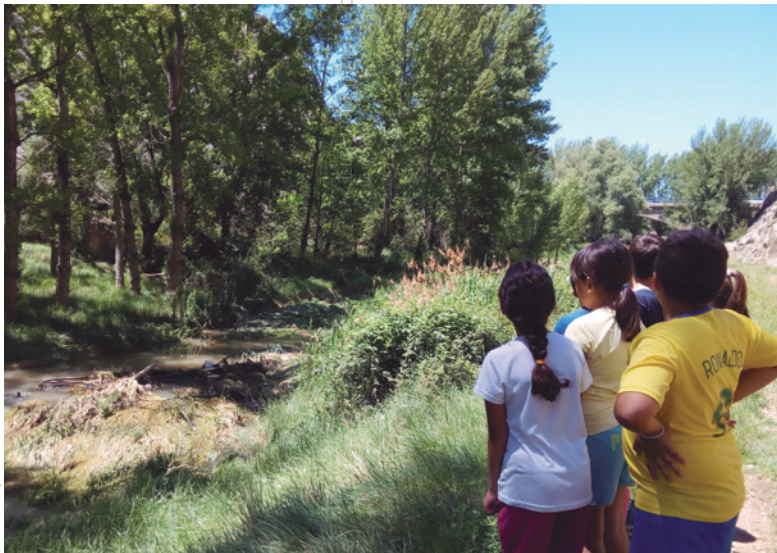
Imagen 1. Analizando los efectos de la riada y limpiando el GR-262

Aunque organicemos el proyecto en estos apartados tenemos que decir que, especialmente, los primeros puntos están presentes a lo largo de todo el proyecto (contenido curricular). Pero, evidentemente, damos mucha importancia a otras habilidades ya mencionadas, puesto que serán de vital importancia en su día a día.