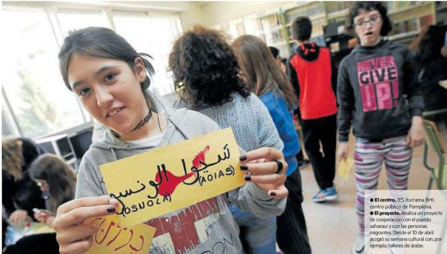
● El centro. IES Iturrama BHI, centro público de Pamplona. ● El proyecto. Realiza un proyecto de cooperación con el pueblo saharauí y con las personas migrantes. Desde el 10 de abril acogió su semana cultural con, por ejemplo, talleres de árabe.