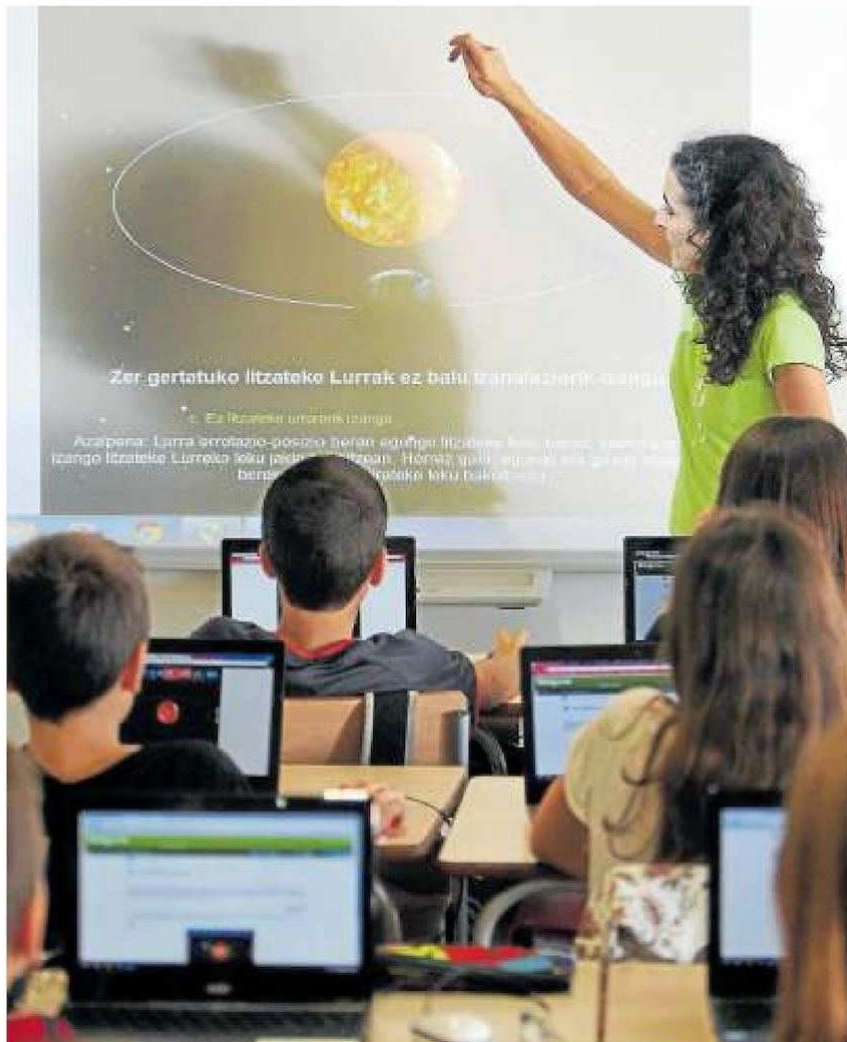
Estudiantes de 1º de la ESO de un centro navarro utilizan el ordenador durante una clase.

En cuanto a otros resultados del sistema navarro, cabe recordar que, según un informe del departamento foral de Educación correspondiente al curso 2015-2016, tres de cada cuatro estudiantes de 4º de la ESO (Educación Secundaria Obligatoria) logra el título sin tener materias pendientes. Otro 15% también logra el título con una o dos asignaturas suspendidas (los porcentajes de aprobados más bajos estuvieron en Matemáticas A y B, con un 83,90% de calificaciones positivas, y Física y Química, con un 89,24%) y casi el 10% del alumnado repite. Con todo, Navarra se sitúa también entre las autonomías por encima de la media en la tasa de graduación de la ESO: el 77,5% de la población de 15 años logró superarla, en este caso en el curso 2013-2014. La media estatal es del 71,7%. ●