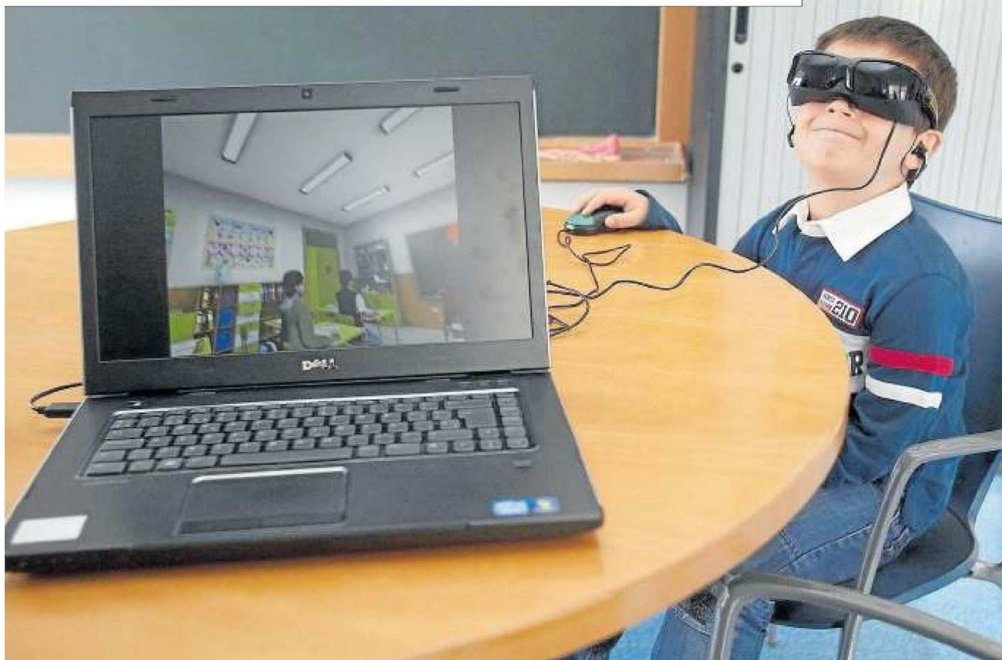
Un niño realiza en un centro escolar una prueba relacionada con el trastorno de déficit de atención e hiperactividad (TDH-A).