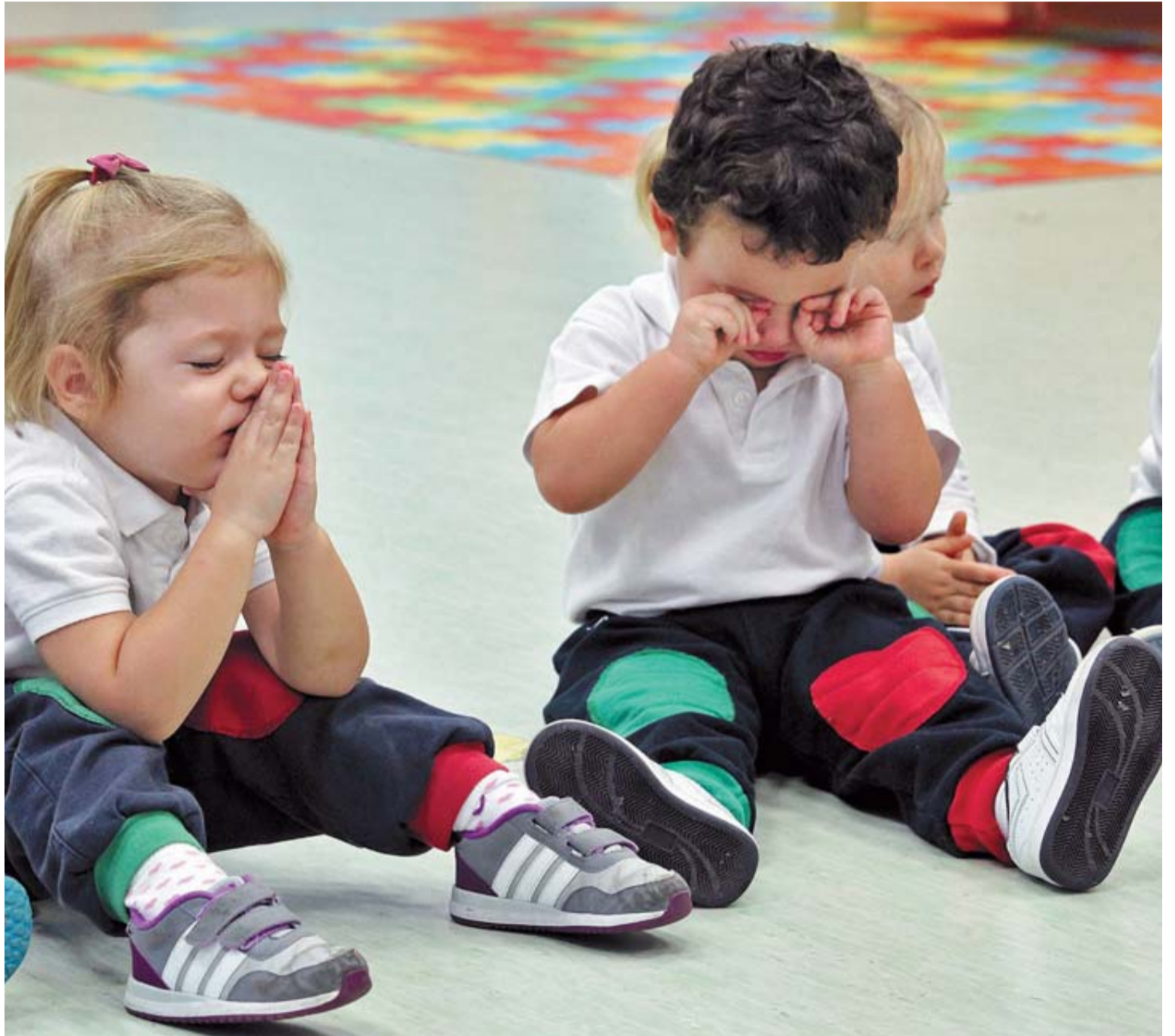
Un grupo de nuevos alumnos de infantil de Claret Larraona que se han sumado este curso al colegio.

Total frente a nuevos alumnos En este punto cabe reseñar dos realidades paralelas en los últimos años. Teniendo en cuenta la curva demográfica, la matrícula en los centros concertados había ido subiendo ligeramente al tiempo que los nuevos alumnos que entraban al sistema, los de primer curso de Educación In-