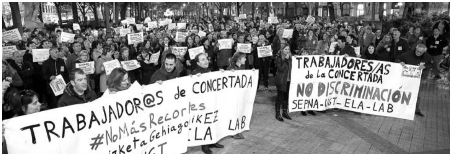
Casi un millar de trabajadores de la concertada se concentraron en noviembre ante el Parlamento para exigir al cuatripartito revertir los recortes.

El malestar en los trabajadores ha ido creciendo a lo largo de 2016 tras infructuosas reuniones y han protagonizado varias protestas, la más numerosa la del 16 de noviembre en la que casi un millar de personas salió a la calle.