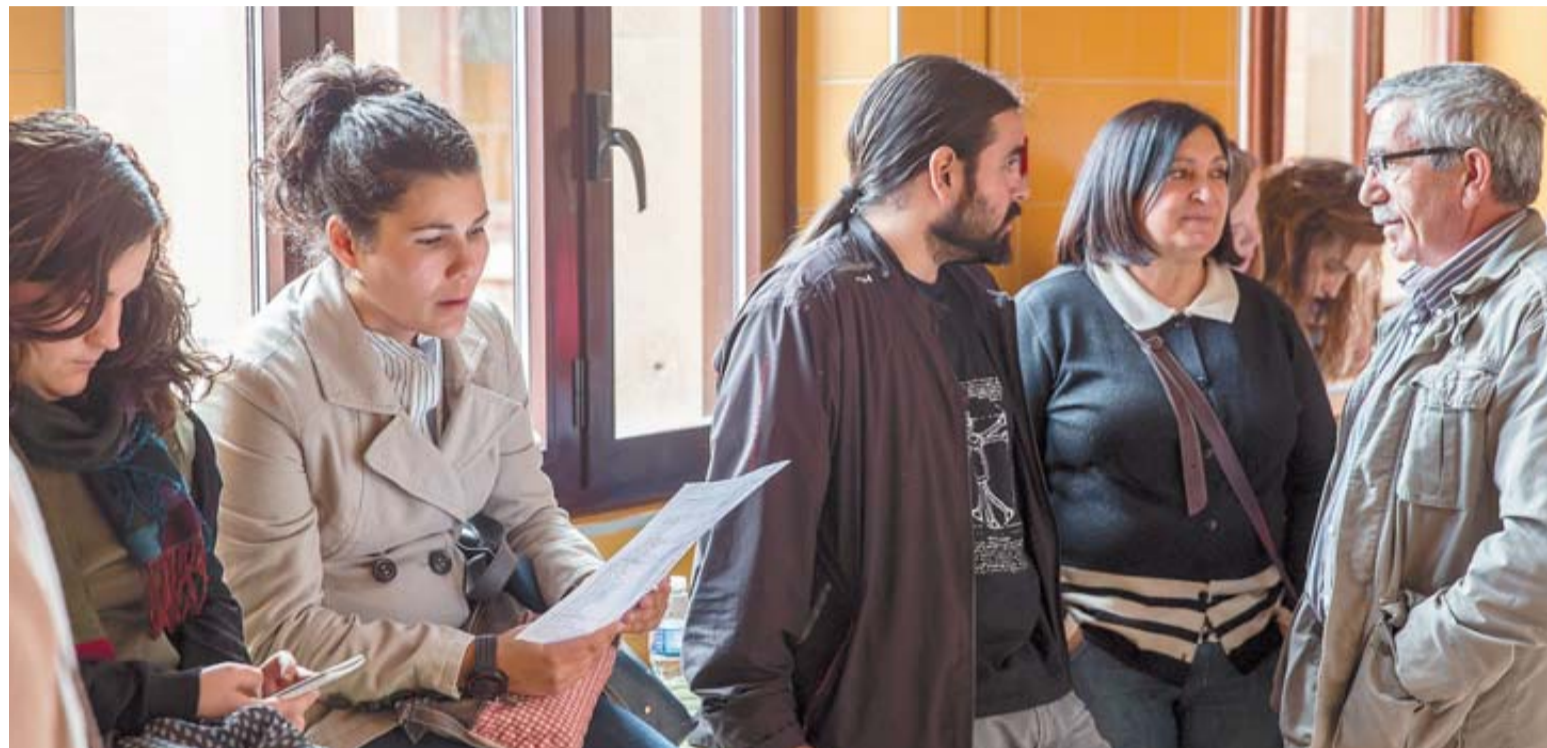
Un grupo de maestros ultiman el repaso antes de enfrentarse a las pruebas de la oposición de especialidades de magisterio. Fue el 18 de junio.