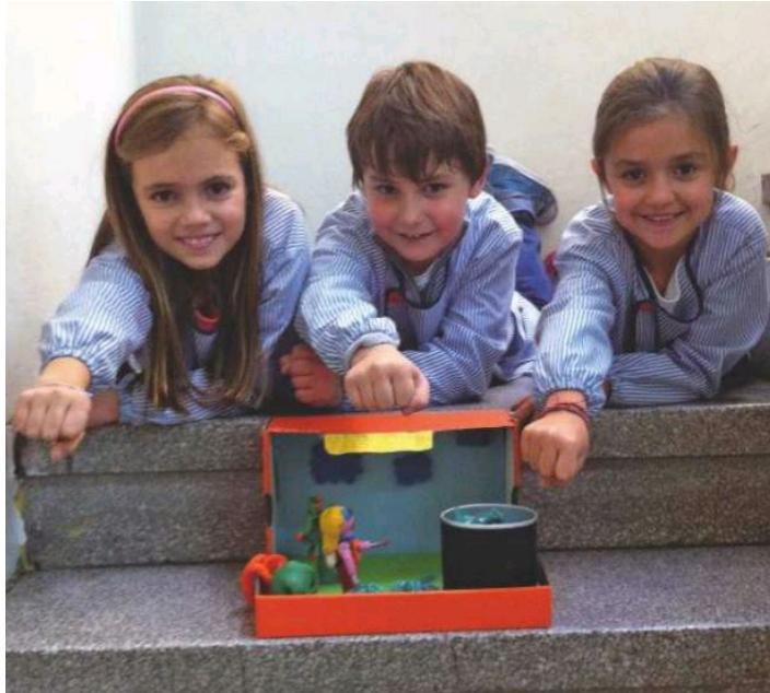
Una superheroína muy especial es la propuesta ganadora del concurso The Power of Ideas .

inglés de una semana de duración. En la convocatoria para el curso 2013-14 (que se puede consultar en: http://www.boe.es/boe/dias/2014/05/19/pdfs/BOE-A-2014-5305.pdf ), el eje temático dado por el Ministerio para concurrir a la beca fue The World Around Us Speaks English , y consistía en preparar una programación semanal que abordara cinco subtemas relacionados con el medio ambiente, uno para cada día de la semana. Así, el lunes se trabajaba el agua, el martes era el día de la Tierra, el miércoles trataba sobre la flora, el jueves se abordaba la fauna y el viernes, como cierre, se centraba en el impacto humano sobre el entorno. Al margen de las expectativas de conseguir la beca, la Escola Ramon Llull consideró que la programación diseñada para dicha convocatoria podría convertirse en un proyecto CLIL ( content and language integrated learning ) como los que se venían realizando en el centro desde hacía años. Y así fue como nació Junior News , un programa de televisión que trata sobre temas relacionados con el medio ambiente y en el