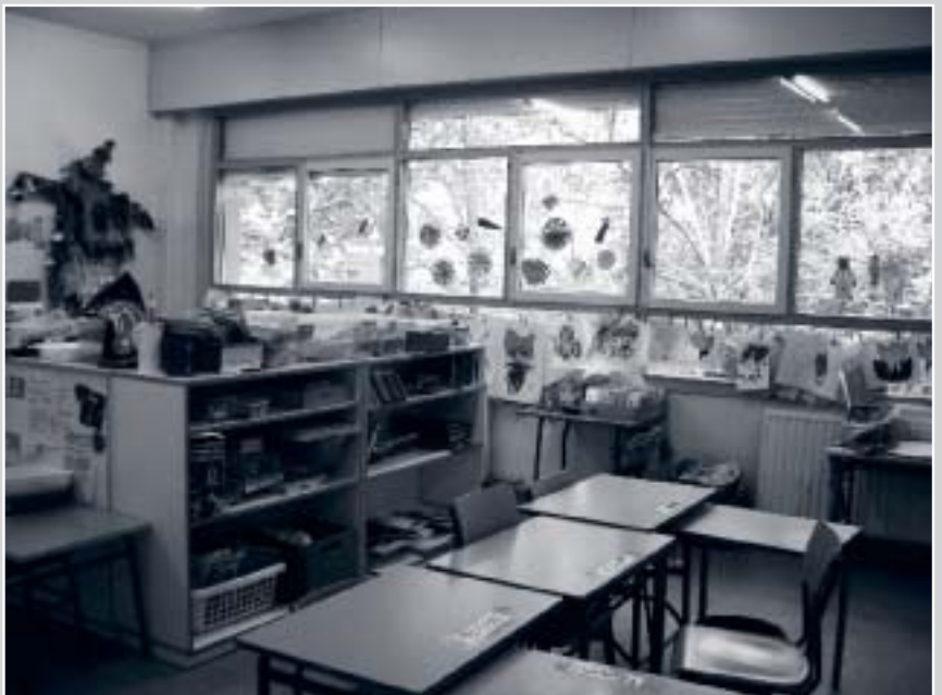
San Pedro de Mutilva Baja IPko Unitate Espezifikoko Gela

Sei edo zazpi urte dituztenean, Haur Hezkuntzan zentro arruntetan egon ondoren, Unitatean sartzen dira (zenbait haur Buruko Osasuneko Haur eta Gazteentzako Unitatearen Eguneko Ospitalean egon dira) eta Lehen Hezkuntzan laguntza sistema orokorrekin bakarrik eskolaratzea ezinezkoa izango dela aztertu ondoren. Gainera, dituzten baldintzak kontuan harturik, Hezkuntza Bereziko Zentro batean sartzen badira estimulutzat hartzen den eta heltzen laguntzen dien testuinguru soziolinguistikotik urruntzen direla kontuan hartzen da.