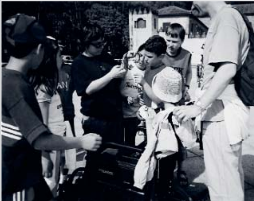
Zoriontasuna, arrakasta eta ezgaitasuna esaldi berean egon daitezke

Eskolazterako eskola inguruan gauzak aldatzea beharrezkoa da ikasketa aukera arrakastatsuek eskaini ahal izateko: ikasleak irakasleak erabiltzen duen bidearen bitartez ikasten ez badu, irakasleak ikasleak ikasteko era-