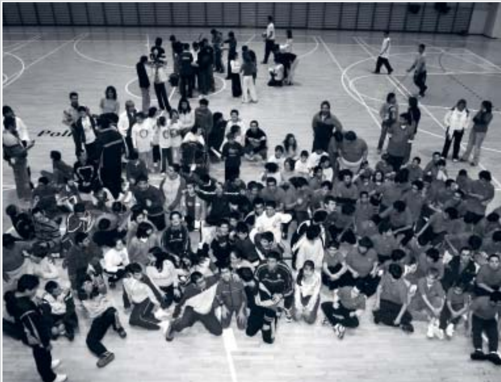
Kirol Egokitutako Nafarroako Federazioak antolatutako Herri Kirolaren eta Tiroen Jardunaldia. "Isterria", "El Molino" eta "Andrés Muñoz Garde" Zentroetako ikasleek parte hartu zuten

Edozein umek ingurutik garrantziko estimuluak ateratzen ditu eta, garapenean zehar inguru fisikoa eta soziala arautzen duten "gakoak" ulertzeko gaitasuna hartzen du (beste pertsonen portaera). Hala ere, zenbait pertsonak garapen prozesu desberdinak eta gaitasun mugatuak dituzte (esaterako, abstrakzio eta sinbolizazio prozesuen arazoak) eta inguruan duten ingurua ulertzeko zailtasunak dituzte.